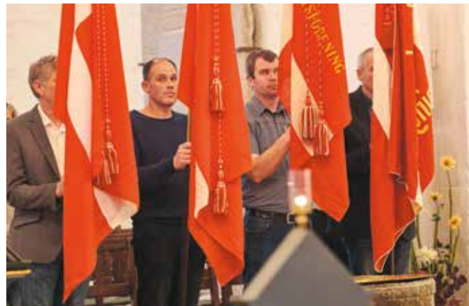
Nogle af fanerne ved markeringen af Danmarks Faldne.