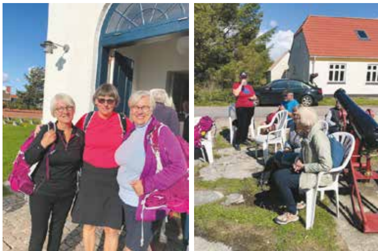
Pilgrimsturen i juni.