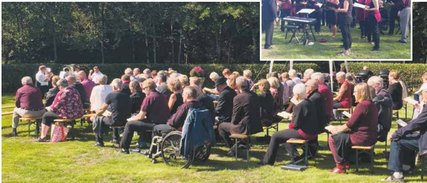
Friluftsgudstjeneste i Krik med Calluna Koret.