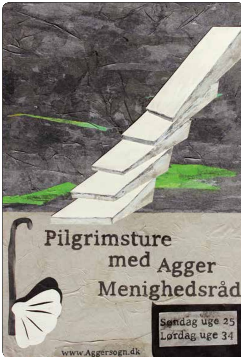
Plakat om pilgrimsturene i Agger.