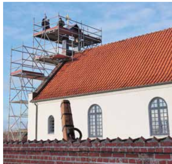
Reparation af klokketårn Agger Kirke, og anlæggelse af kirkesti.