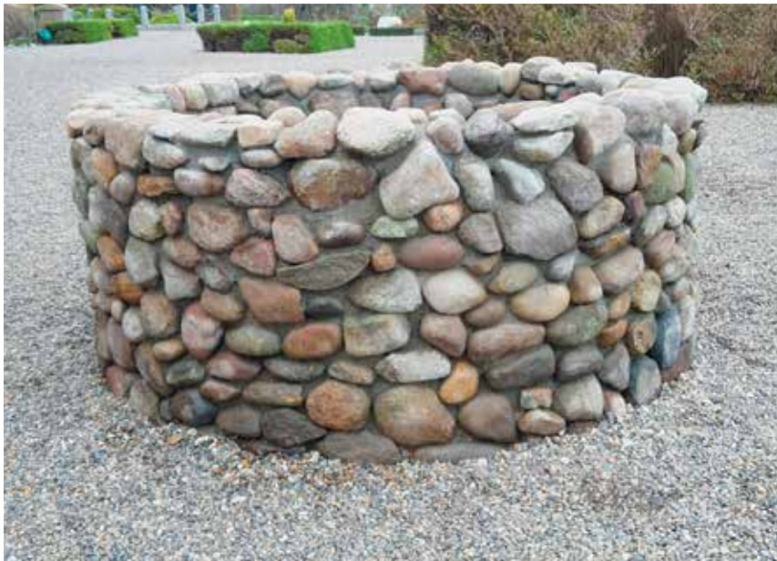
Den genopførte brønd på Vestervig Kirkegård.