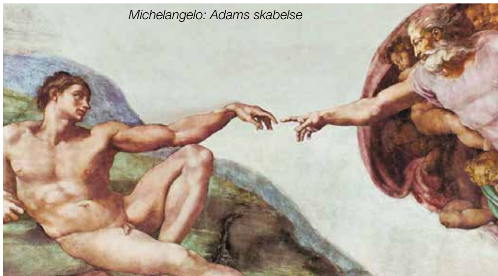
Michelangelo: Adams skabelse

Ateisterne har også et brutalt menneskesyn, hvor alt er re-