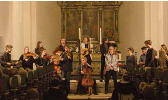
Koncert med musikstuderende fra Folkemusikkonservatoriet i Esbjerg.