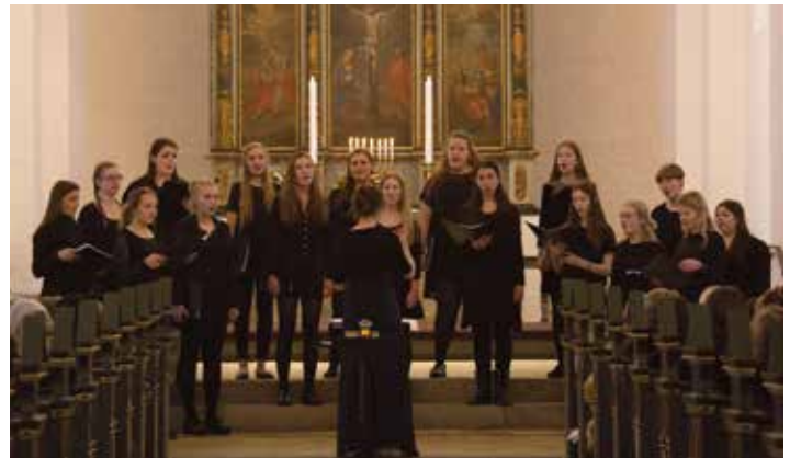
Koncert med Landskoret.