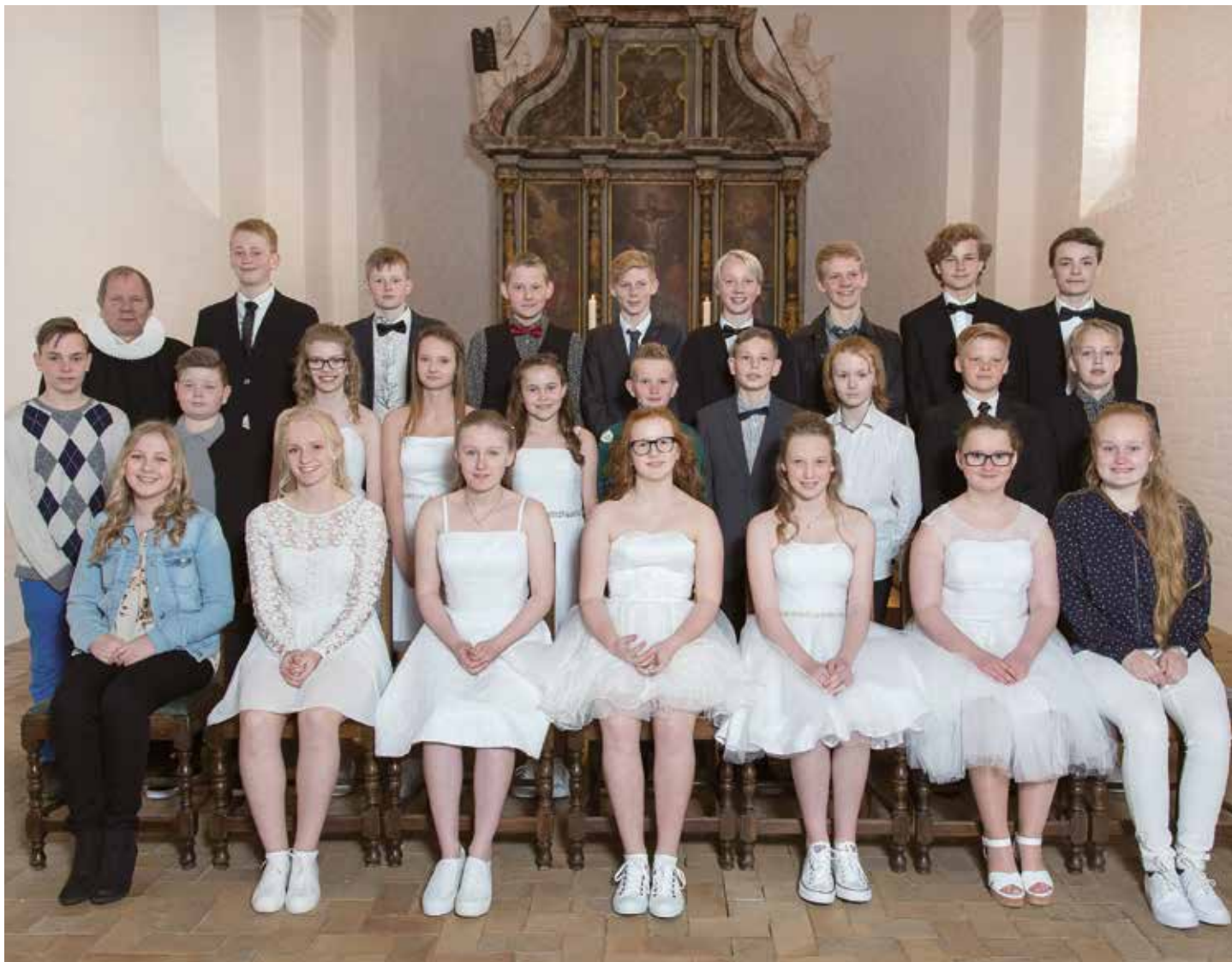
Gruppebillede af årets konfirmander fra Agger og Vestervig Sogne.