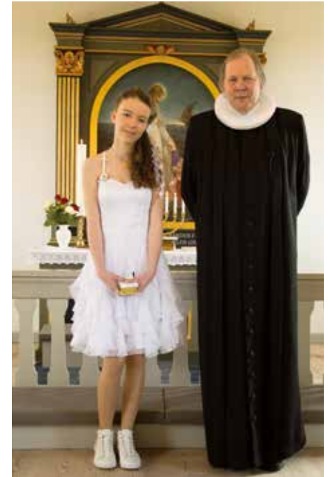
Årets konfirmander i Vestervig og Agger Kirke